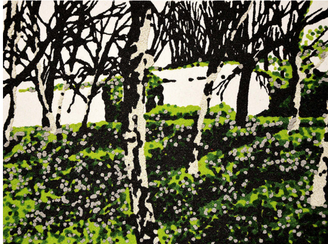
Le ravin du loup #33 Flocages de modélisme sur carton-gris 30 x 40 cm, 2019